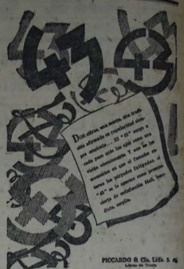
PICCARDO & Cia. Ltda. 3 & 4 Librería de Trujillo